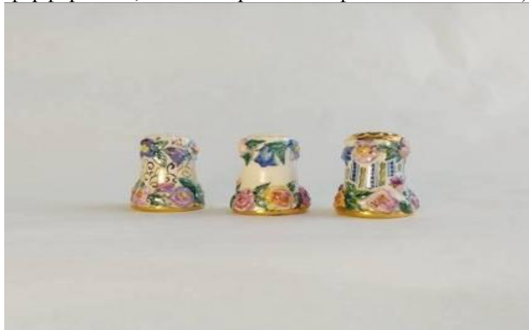
Рисунок 15. Наперстки в розписі керамічними фарбами і золотом, а також із пластичним моделюванням. Варіанти розробок фірми «Alis-K°». 2018.