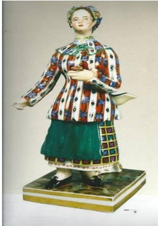
Рисунок 5. Фарфоровий завод А. Мікласhevського. Скульптура «Українка». Варіант розпису.

Figure 5. A.Miklashevski's porcelain factory. A sculpture «Ukrainian». A variant of a picturesque decor.