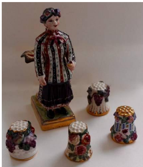
Рисунок 11. Репліка «Українки» заводу А. Мікласhevського. 2018. Розпис фірми «Alis-K°». Figure 11. Remark of «Ukrainian» of factory A.Miklashevskogo. 2018. Painting of firm «Alis-K°».