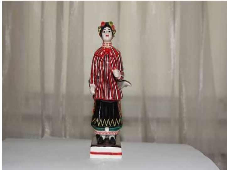
Рисунок 9. Репліка «Українки» заводу А. Мікласhevського. 2018. Розпис фірми «Alis-K°». Figure 9. Remark of «Ukrainian» of factory A.Miklashevskogo. 2018. Painting of firm «Alis-K°».