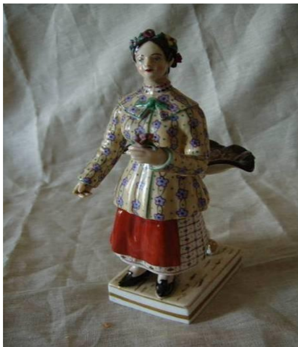
Рисунок 8. Фарфоровий завод А. Міклашевського. Скульптура «Українка». Варіант розпису. Figure 8. A.Miklashevski's porcelain factory. A sculpture «Ukrainian». A variant of a picturesque décor.

Суттєво різняться не тільки розфарбування одягу «Палажки», а й подіуму, на якому вона стоїть, що свідчить про можливі вияви почерку різних волокитинських митців (рис. 8).