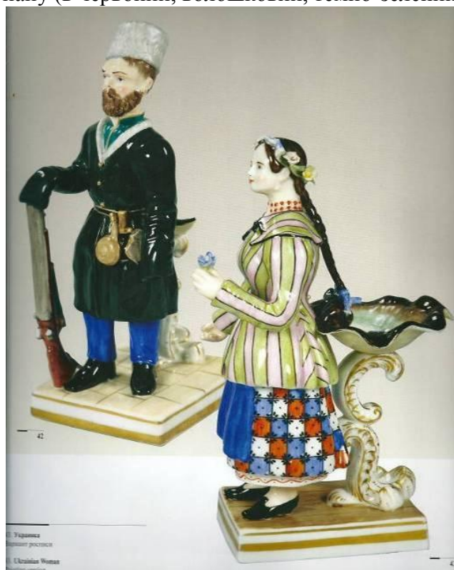
Рисунок 3. Фарфоровий завод А. Міклашевського. Скульптура «Українка» та «Козак на посту». Варіант розпису.

Фігурка стоїть у центрі низького прямокутного цоколя, злегка притулена до мушлі на рокайльній ніжці. Композиція не замкнена та при круговому огляді дозволяє відчутти художню виразність круглої скульптури з різних ракурсів. Усі екземпляри «Козака зі зброєю» вирішені стримано (рис. 3), розписані у локальні кольори, при чому основна увага приділялася тонуванню жупану (в червоний, волошковий, темно-зелений барви).