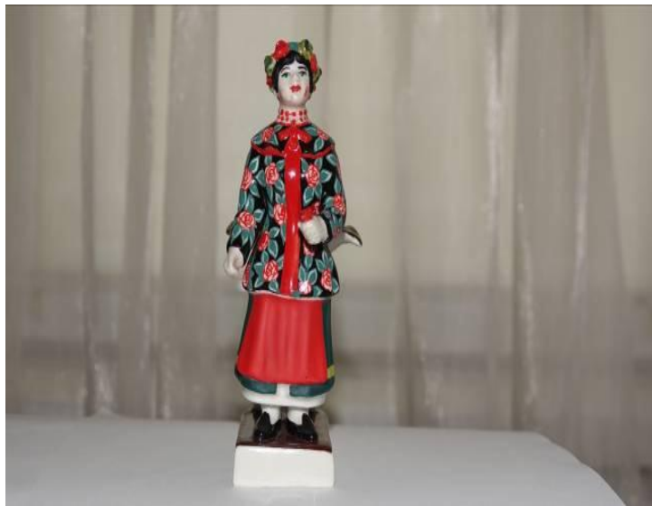
Рисунок 10. Репліка «Українки» заводу А. Мікласhevського. 2018. Розпис фірми «Alis-K°». Figure 10. Remark of «Ukrainian» of factory A.Miklashevskogo. 2018. Painting of firm «Alis-K°».