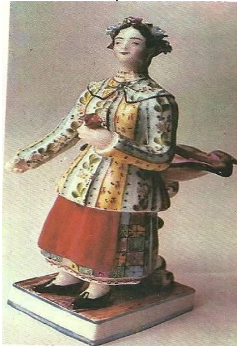
Рисунок 6. Фарфоровий завод А. Мікласhevського. Скульптура «Українка». Варіант розпису.

Деякі моделі (рис. 6) усміхнені, дещо вигнуті назад.