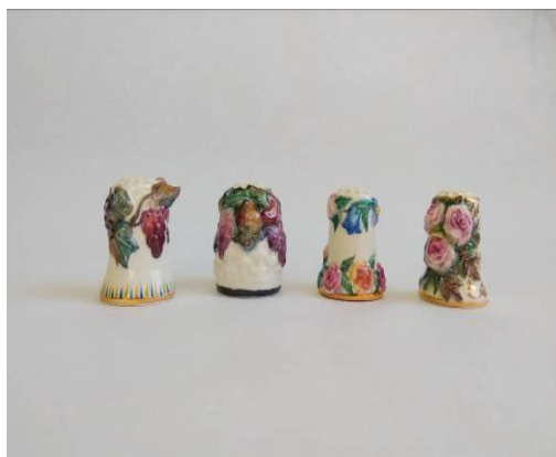
Рисунок 14. Наперстки в розписі керамічними фарбами і золотом, а також із пластичним моделюванням. Варіанти розробок фірми «Alis-K». 2018.

4 різновиди скульптурного сюжету апелюють до вічної символіки. Так, виноградна лоза є символом Ісуса Христа та його самопожертви в ім'я людства, троянда – усталений символ Богородиці, гірлянда – розглядається в аспекті символіки родинного зв'язку, кошик – символ плодючості та добробуту. Ці вічні мотиви були впізнавані й важливі для людей середини XIX ст. (рис. 14).