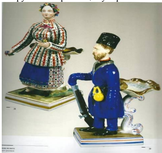
Рисунок 2. Фарфоровий завод А. Міклашевського. Скульптура «Українка» та «Козак на посту». Варіант розпису.

Парною статуеткою до «Українки» є скульптура «Козак на посту». Інакше його називають «Мисливець», «Козак зі зброєю», «Уральський козак» (відомі екземпляри в середньому мають заввишки від 23,5 до 24,1 см). Це зображення бородатого чоловіка у довгому жупані та шапці кшталту смушкової. Цей герой зображений з круглою порохівницею та кинджалом біля поясу, правою рукою він тримає цівку вертикально стоячої зброї (рис. 2).