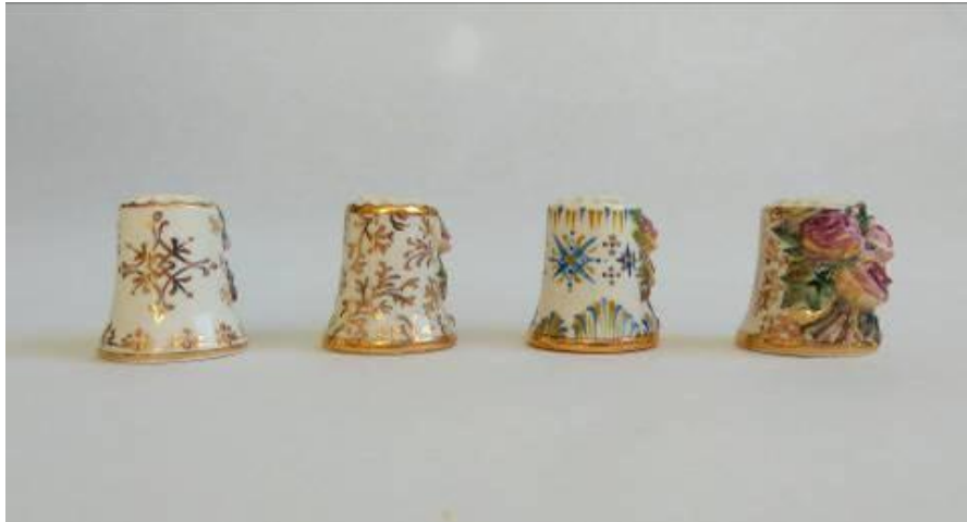
Рисунок 12. Наперстки стандартної форми у розписі керамічними фарбами й золотом, а також із пластичним моделюванням. Варіанти розробок фірми «Alis-K°». 2018.

В ансамблях подарункових виробів від фірми С. Воронова «Alis-K°» «Українка» – це привід згадати автентичні унікальні першовзірці, а головним новітнім предметом, виконаним у стилістиці справдешнього Волокитиноного, є саме наперсток (Рис. 12), що виконує оберегову функцію. Це основний предмет випуску, якого «супроводжує» принадна панянка у національних строях.