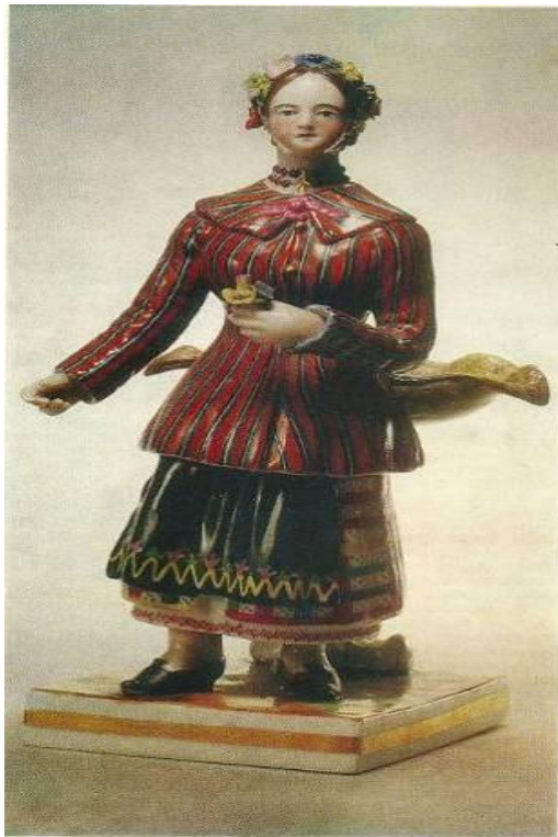
Рисунок 7. Фарфоровий завод А. Міклашевського. Скульптура «Українка». Варіант розпису. Figure 7. A.Miklashevski's porcelain factory. A sculpture «Ukrainian». A variant of a picturesque décor.

Суттєво різняться не тільки розфарбування одягу «Палажки», а й подіуму, на якому вона стоїть, що свідчить про можливі вияви почерку різних волокитинських митців (рис. 8).