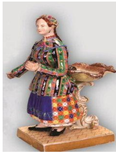
Рисунок 1. Реконструкція давньогрецької кори в пеплосі і «Українка» заводу А. Міклашевського Figure 1. Reconstruction of Ancient Greek Bark in Peplos and «Ukrainka» at A. Miklashevsky Plant