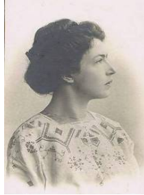
Рисунок. 1. Єлизавета Трипільська – поміщиця Опішного, Зінькова, випускниця Полтавського інституту шляхетних панянок 1896 р., керамістка й майбутня скульпторка, відома на кількох континентах.

Дитинство майбутньої знаної скульпторки проходило в атмосфері тісного спілкування з повним спектром народного гончарства, характерного для Полтавської землі й, зокрема, Опішного, професійною керамікою і її різновидами посудних форм, пластикою, промисловими зразками кахлів, дахівки, труб; творами високого живопису й специфічної мистецької атмосфери краю (Рис. 1).