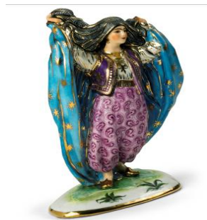
Рисунок 3. Трипільська Є. Р. «Східна жінка, що знімає чадру» («Афганка»). Варіант розпису. ЛФЗ. Кінець 1920-х – початок 1930-х рр. Фарфор, надглазурний розпис. Приватна збірка.

Не перебуваючи в штаті Ломоносовського фарфорового заводу, Єлизавета Трипільська виконала для нього кілька скульптур [9; 17]. Протягом 1926–1928 рр. скульпторка здебільшого працювала в Ашхабаді. Але за даними Центрального державного архіву народного господарства СРСР, у переліку фарфорових виробів Державного порцелянового заводу, прийнятих на ювілейну виставку Мосради 18 листопада 1927 року, під № 55, значиться фігура «Східної жінки», Рисунок Є. Трипільської [17, с. 251–253]. Тобто один з варіантів відомої «Афганки», що є водночас одним з кращих творів зрілої Єлизавети Трипільської, міг бути виготовлений вже наприкінці поточного року. (Іноді скульптуру називають «Бакинська» або «Азербайджанка», але в оригінальному варіанті, зважаючи на авторський розпис, за якого фігура жінки в яскравому одязі стоїть на вимальованому клаптику землі із назвою Афганістан, – «Афганка») (Рис. 3).