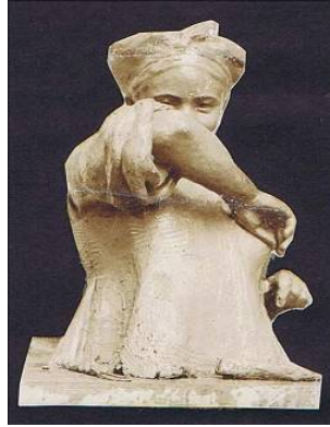
Рисунок 2. Ранній «етнографічний» період творчості Єлизавети Трипільської. Бюст «Молодиця». США – Ізраїль.

Виконані впродовж 1904–1909 рр. «Селяни», «Водяник», «Портрет хлопчика» та «Цокотуха» (останні роботи датуються 1908–1909-ми рр., згодом за них мисткиня отримала Куїнджівську премію [22]), були вперше виставлені 1909 р. на виставці в Києві, як і теракотові (керамічні) погруддя дівчат, молодиць (Рис. 2),