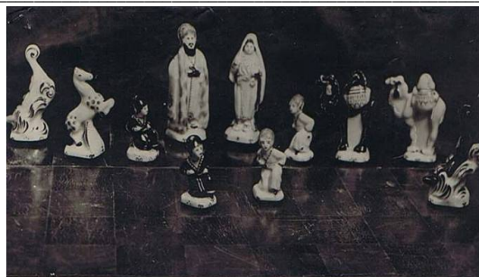
Рисунок 4 і 5. Фарфорові шахи «Туркменські» авторства Єлизавети Трипільської. Дмитровський фарфоровий завод. Унікальні світлини подарунку кращого досягнення радянської промисловості доби індустріалізації від Уряду Радянського Союзу президенту США Ф. Рузвельту 1928 р. Архів племінника Єлизавети Родіонівни Трипільської Олега Володимировича Трипільського та його нащадків. Світлина надана внучатим племінником скульпторки, відомим архітектором США та Ізраїлю Волею Трипільським.

один примірник яких був подарований радянським урядом президенту США Ф. Рузвельту [25]. Можливо й понині десь у американських колекціях Білого Дому або в муніципальних збірках Вашингтону зберігається часточка доробку визначної опішнянки Єлизавети Трипільської, творчість якої була варта міжконтинентальних дипломатичних відносин.