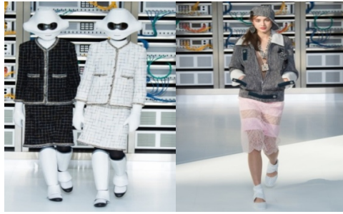
Рисунок 12. Весна-літо 2017. Тиждень моди: Париж. Chanel

В Україні цю тенденцію як поєднання гранжу з харизматичною романтичністю моделі в контрастному поєднанні темного з яскравим мідним у стайлінгу демонструє взірець 2017 р., (Рис. 13)*.