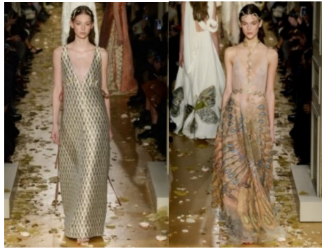
Рисунок 6. Весна-літо 2016. Тиждень моди: Париж. Valentino