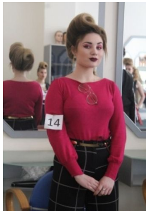
Рисунок 11. Весна-літо 2017. Стилістика beat icon

Вкрапленням андрогінності в зачісці на основі стилю 60-х рр. стала виразна букля в лобно-тім'яній зоні, висвітлене волосся з затемненням прикореневої зони з м'яким переходом до світлих кінців (Рис. 11).