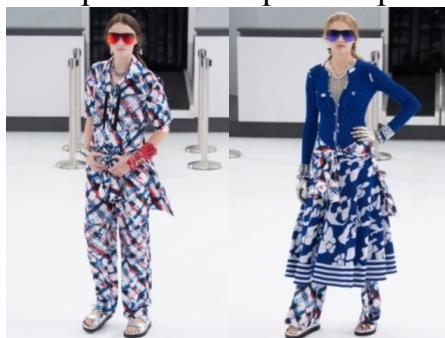
Рисунок 1. Весна-літо 2016. Тиждень моди: Париж. Chanel

Стилістиці urban sports , що дослівно перекладається як «міський вид спорту», відповідають різноманітні спортивні костюми. У 2016 р. вони отримали форму «повітряних» у інтенсивно-насиченій кольоровій гамі [1]. У колекції Chanel ( Шанель ) Карла Лагерфельда декоративним рішенням спортивних костюмів було використання абстрактних яскравих принтів (Рис. 1).