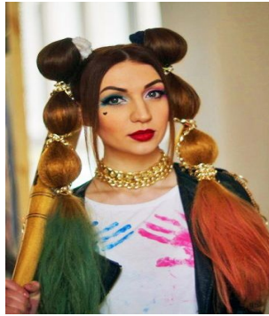
Рисунок 2. Весна-літо 2016. Стилістика urban sports

Стиль free creation , що в перекладі означає «вільне створення», характеризує багатшарове вбрання, переважно, із тканин світлого тону в розмаїтті гами нейтрально-пастельних відтінків. Стайлінг даного стилю – текстуровані та графічні форми. Їх втілили короткі зачіски, стилізовані за формою під популярні впродовж другої половини ХХ ст. молодіжні стрижки «Гаврош» та «Гарсон» [1]. Їхня графічна силуетна форма походить від чоловічих, хлопчачих зачісок, що утілюються у варіантах жіночих зачісок для різних вікових категорій у вигляді короткого на скронях та потилиці волосся та подовжених пасм на лобно-тім'яній частині («гарсон»), у нижньо-потиличній зоні («гаврош»), актуалізованих «рваним» ефектом.