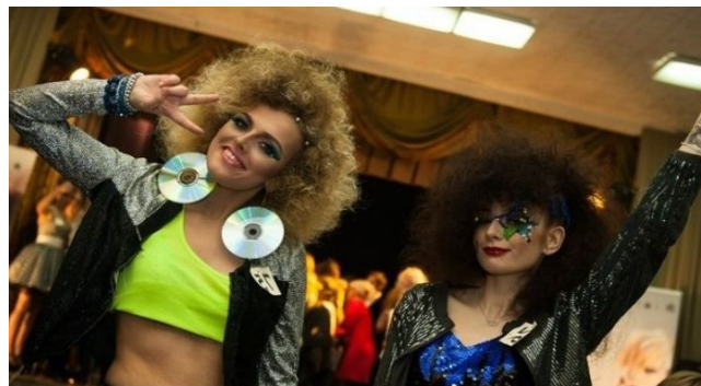
Рисунок 7. Весна-літо 2016. Стилiстика future wave