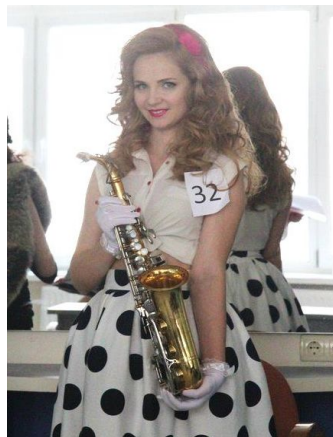
Рисунок 9. Весна-літо 2017. Стилістика орulent

Стиль «орulent», виражений в текстурних локонах, на вітчизняному «ІХ Фестиваль молодих дизайнерів зачіски та стилю» (травень 2017 р.) продемонструвала модель, стилізована під образ 50-х у костюмі з характерним силуетом (Рис. 9).