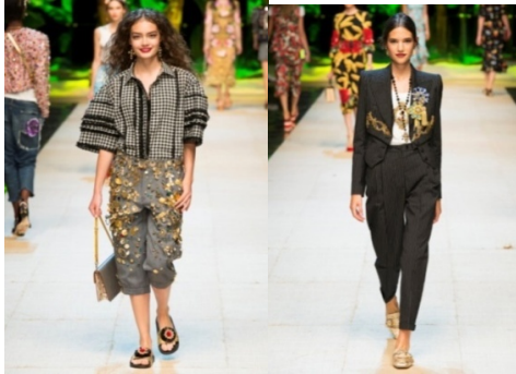
Рисунок 10. Весна-літо 2017. Тиждень моди: Милан. Dolce&Gabbana

обшитих паетками. Образ доповнювали зачіски, представлені як об'ємні та текстуровані, або гладко зачесані та зібрані за допомогою зажиму в нижньо-потиличній зоні (Рис. 10).