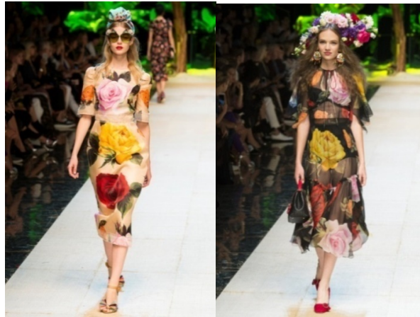
Рисунок 8. Весна-літо 2017. Тиждень моди: Милан. Dolce&Gabbana

Стиль «орulent», виражений в текстурних локонах, на вітчизняному «ІХ Фестиваль молодих дизайнерів зачіски та стилю» (травень 2017 р.) продемонструвала модель, стилізована під образ 50-х у костюмі з характерним силуетом (Рис. 9).