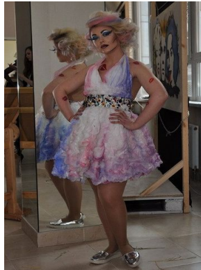
Рисунок 4. Весна-літо 2016. Стилістика free creation

Також на цьому фестивалі, в номінації Music star, із довгого волосся було стилізовано зачіску, яка імітує завиту щипцями стрижку «гарсон» у пастельній кольоровій гамі (Рис. 5).