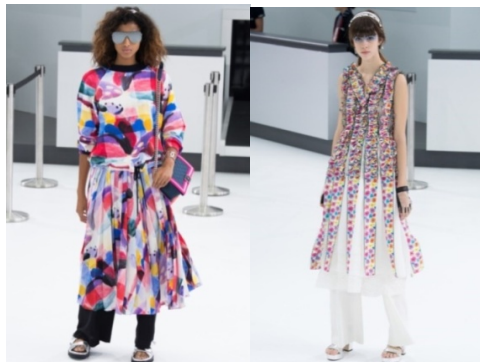
Рисунок 3. Весна-літо 2016. Тиждень моди: Париж. Chanel

У колекції Шанель, яка продемонструвала багатшаровий одяг, зокрема, спідниці світлих ніжних відтінків, трендами зачісок виявилися моделі середньої довжини волосся у вигляді текстурованих укладок романтичного стилю на основі «гаврош» і «гарсон», та довге ідеально рівне волосся (Рис. 3).