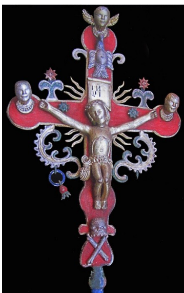
Рисунок 4. Процесійний хрест XIX ст., дерево, різьба, поліхромія, імітація позолоти, (213x81x10,5см).

Найуживанішим матеріалом у виготовленні досліджуваних сакральних атрибутів є деревина різної породи. Для різьблення та інкрустацій використовуються переважно тверді породи дерев – груша, бук, клен. Виготовляють вироби столярним або токарним способом. Для прикрашення сакрального предмета підбирають відповідні мотиви. В орнаментиці використовують стародавні знаки «сонечко», «зірочки», характерні для розпису писанок, мотиви природних рослинних форм. Отже, можемо виокремити типологічну групу за наступною технікою виконання.