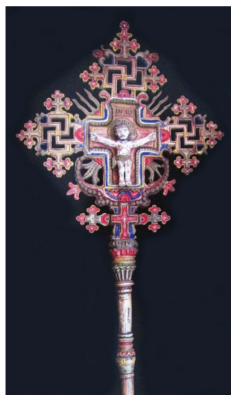
Рисунок 5. Процесійний хрест 1893 р., дерево, рельєфна різьба, поліхромія, (205x76x9,5см). Церква Успіння Св. Анни с. Бистрець Верховинського району

Figure 4. Processional cross of the 19 th century, wood, carving, polychrome, imitation of gilding, (213x81x10,5 cm). The Church of Dormition of Saint Anne, village of Bystrets of Verkhovyna district, Ivano-Frankivsk region (image of A. Kis)