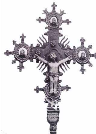
Рисунок 3. Процесійний хрест кінця XVIII ст., дерево, профілювання, рельєфно-ажурна різьба, поліхромовання. Гуцульщина, с. Криворівня Верховинського р-ну

Figure 2. Outside cross, the end of the 18 th century, wood, profiling, flat-pierced work, polychrome. Hutsul region, the village of Kryvorivnia, Verkhovyna district