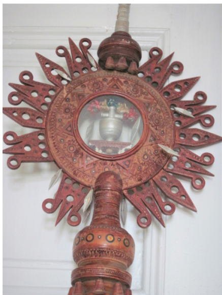
Рисунок 1. Патериця XX ст., дерево, профілювання, точіння, інкрустація, с. Назірна Коломийського р-ну, (КМНМГП Інв. № 10108)

До проаналізованих взірців кінця XIX – початку XX ст. можна додати запрестольні патериці зі Святилиця храму катедрального собору Святого Воскресіння м. Івано-Франківська та патериці, розташовані в крилосі монастирського храму Різдва Пресвятої Богородиці м. Тисмениці, виконані невідомим автором. На патерицях обох церков різні іконографічні зображення, щоправда, орнаментальне тло є дещо спорідненим. Орнаментику подано по всій площині з обрамленням медальйонів у вигляді сонця із зображеннями «Воскресіння Христове», «Успіня Богородиці», «Різдво Богородиці», «Розп'яття Господнє», «Богородиця Одигітрія», «Св. Миколай Чудотворець», «Богородиця в Славі (коронація Богородиці)», виконаними в техніці карбування (Рис. 2).