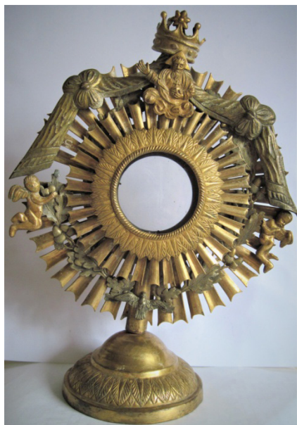
Рисунок 8. Дароносиця ХХ ст., метал, карбування, 27х20см., ТКМ 20226, Інв. № К – 30 (фондосховища) Figure 8. Pux of the 20th century, iron, minting, 27x20 cm, TCM 20226, Inv. No. K - 30 (museum depository)