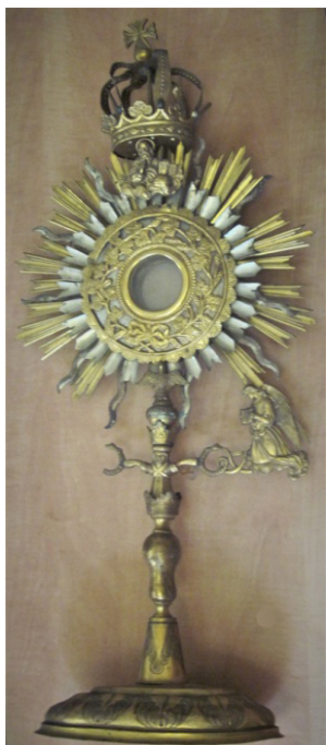
Рисунок 3. Дароносиця ХХ ст., метал, карбування.