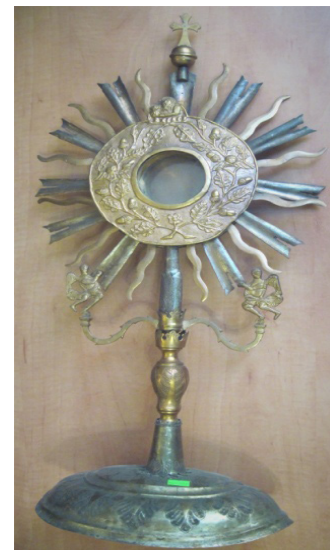
Рисунок 7. Дароносиця XX ст., скло, метал, карбування, церква с. Солонсько, Дрогобицький р-н Львівська обл., Музей історії релігії м. Львова, Інв. № МТ – 908, (фондосховища) Figure 7. Pyx of the 20th century, glass, iron, embossing, Church, Solonskoho-Drohobych district, Lviv Museum of the History of Religion, Inv. No МТ - 908, (museum depository)

При порівнянні патериць і дароносиць простежується схожість у манері виконання, коли однією з особливостей декорування є натуральність квітів і плодів жолудя з листям. Так, дароносиці з фондів Краєзнавчого музею м. Тернополя (Інв. № К – 30) (Рис. 8) та Музею історії релігії м. Львова (Інв. № МТ – 908) (Рис. 9) декоровані орнаментом дубового листя та жолудів. Використання квіткових мотивів також об'єднує центральну дискову частину на досліджуваних предметах. У зигзаг, утворений виноградною лозою, вплітався вінок із квітів, як можна побачити на дароносиці з експозиції Музею історії релігії міста Львова. Таке квіткове композивання є близьким за декором обрамлення до іконного зображення на патерицях храмів початку XX ст.: Пресвятої Євхаристії м. Львова, катедрального собору Святого Воскресіння м. Івано-Франківська та діючого храму на території музею архітектури й побуту с. Крилоса.