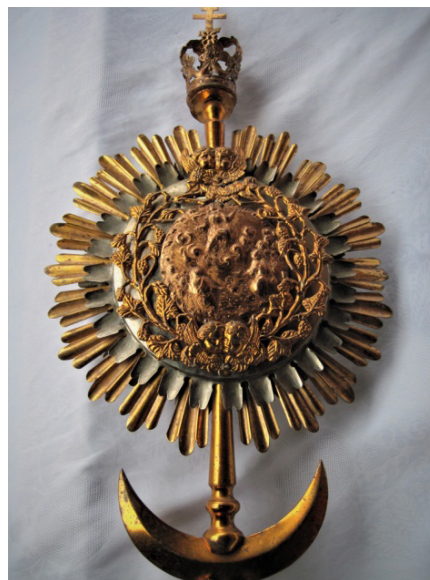
Рисунок 2. Патериця XIX ст. (фрагмент ангелів під викарбуваним сюжетом), мідь, латунь, позолота. Монастирська Богородична церква м. Тисмениці