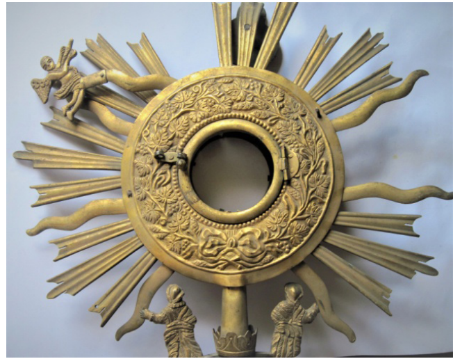
Рисунок 6. Зворот дароносиці XX ст. (фрагмент), метал, карбування, позолота, Тернопільський краєзнавчий музей, Інв. № К-101, (фондосховища) Figure 6. Pyx' Flipside of the 20th century (fragment), iron, embossing, gilding, Ternopil Local History Museum, Inv. No. K-101, (museum depository)

Особливо цікавим за манерою виконання є процесійні атрибути, у яких можна розгледіти, як вжито традиційне декорування або ж як натуралістично виділяються колоски пшениці й виноград. У декоруванні дароносиць розповсюджений рослинний орнамент. Помітна перевага в рослинних візерунках належить гнучким стеблам, листкам, квітам, плодам. Головні з них – гілки з листками та плодами. Варто зазначити, що центральним і домінуючим мотивом декору культових атрибутів є рослинний орнамент, який органічно вплітається в s-подібні фігури з листя винограду та його грон, а також дубового листя і плодів жолудя (Рис. 7).