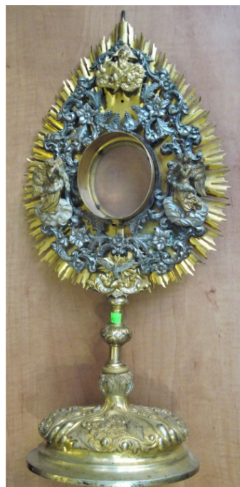
Рисунок 4. Дароносиця ХХ ст., бронза, литво,

карбування, позолота, 60x29см., Музей історії релігії м. Львова, Інв. № МТ – 425 (фондосховища)