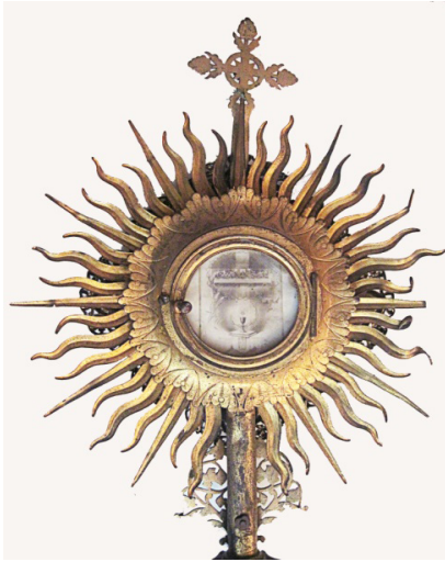
Рисунок 5. Фрагмент патериці XX ст. (зворот), метал, карбування, позолота. Музей історії давнього Галича (фондосховища) Figure 5. Crosier' Fragment of the 20th century (flipside), iron, minting, gilding. History Museum of Ancient Halych (museum depository)

На основі наведених співвідношень можна зробити висновок, що в мистецьких пам'ятках центральною є верхня частина, котра виділяється особливою пишністю. Як бачимо, така трансформація форм була притаманною для висвітлення творів культового призначення з характерною ознакою неперевантаженості, хоча декоративні елементи дуже часто вагомі й динамічні.