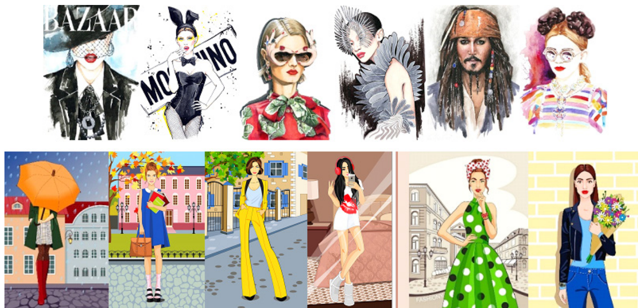
Рисунок 5. Fashion-ілюстрації Наталії Волобуєвої Figure 5. Fashion illustrations by Nataliia Volobueva

для брендбуків дизайнерів і стартапів, fashion-листівки, ілюстрації для глянцевого видання, принти для друку на дизайнерських футболках і світшоти. У своїй роботі художниця віддає перевагу таким технікам, як акварель, гуаш, туш, акрил та Digital illustration on iPad, Adobe Illustrator (Рис. 5).