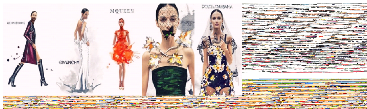
Рисунок 6. Fashion-ілюстрації Юлії Славінської Figure 6. Fashion-illustrations by Julia Slavinska

Нестандартними підходами до створення модних ілюстрацій вирізняється Юлія Славінська, яка в 2011 р. познайомилася з художнім редактором LZ magazine, для якого створила кілька тематичних ілюстрацій. Це стало початком кар'єри молоді художниці (Рис. 6).