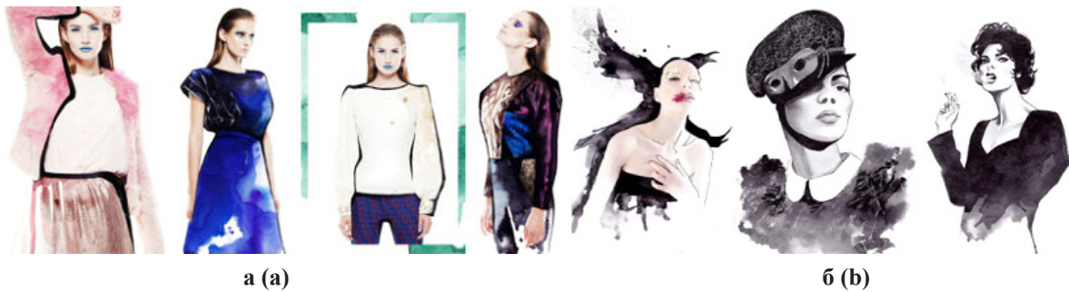
Рисунок 8. Фото-ілюстрації Юлії Славінської у спільному проєкті з Анастасією Арсенік для FANUM magazine (a) та приклади векторних ілюстрацій (б) Figure 8. Photo illustrations by Julia Slavinska in a co-project with Anastasia Arsenik for FANUM magazine (a) and examples of vector illustrations (b)