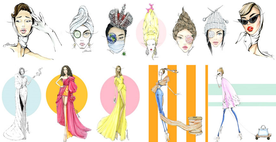
Рисунок 9. Акварельні ілюстрації Мар'яни Марше Figure 9. Watercolour illustrations by Mariana Marche