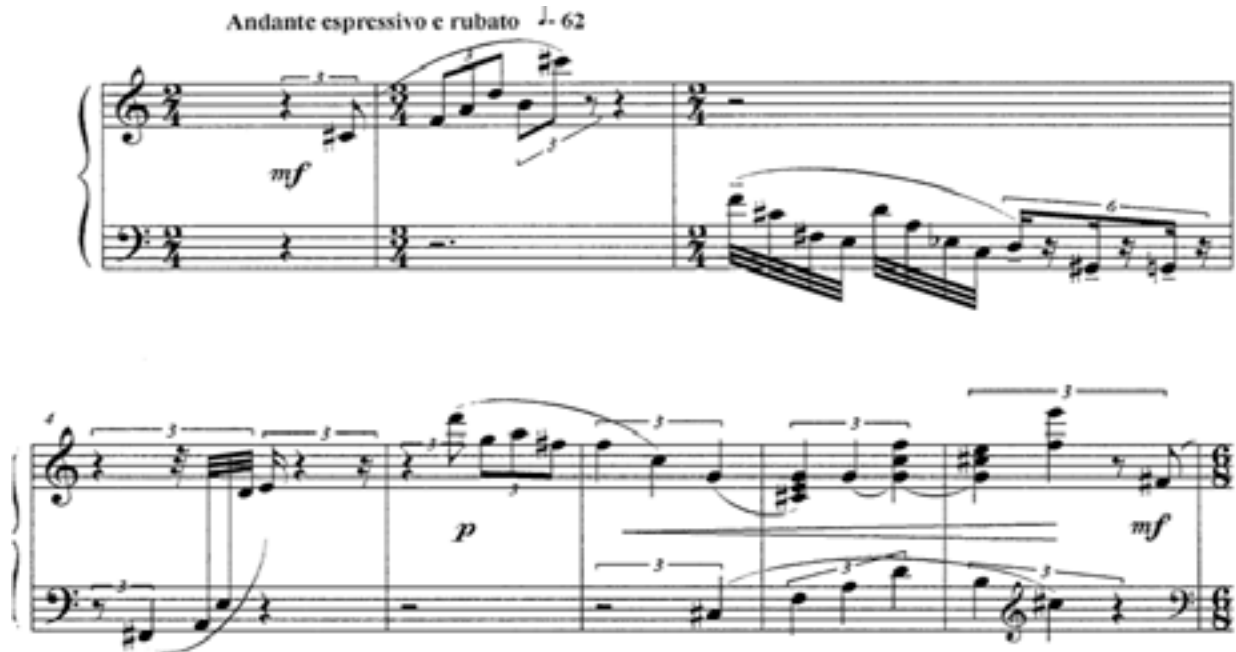
Пример 5. Г. Чобану. Натюрморт с цветами, мелодиями и гармониями 6 Example 5. Gh. Ciobanu. Still-life with flowers, melodies and harmonies 6

Согласно динамическим, агогическим обозначениям и фактурному рисунку в пьесе можно выделить три основных раздела: первый — тт. 1–58, Andante espressivo e rubato ; второй — тт. 59–73, Brilliantissimo ; и третий — тт. 74–89, Espressivo . В исполнении всей пьесы следует уделить особое внимание точному выполнению динамических нюансов, следованию фразировочным и штриховым обозначениям, подробно выписанным автором и помогающим раскрытию внутреннего мира произведения. Умение убедительно воссоздать посредством фортепианного звучания художественный образ Натюрморта ... во многом зависит от уровня эстетического сознания, разнообразия образно-ассоциативного ряда и наличия богатой палитры звуковых красок пианиста-интерпретатора. В узкотехническом смысле от исполнителя потребуются грамотный подбор аппликатуры, отточенность пальцевых движений, ясная артикуляция, а также применение техники растяжений ввиду широкой интервалики мелодических линий.