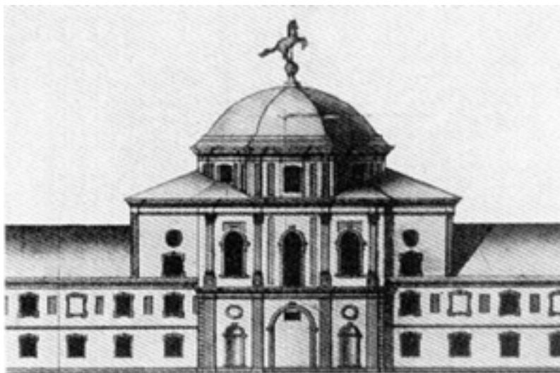
Рисунок 2. Головний фасад Придворно-Конюшенного відомства з 1747 по 1817 рр.