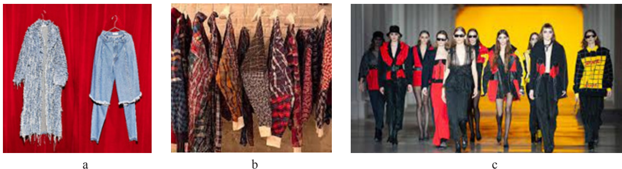
Рис. 2. Апсайклінг-пропозиції українських брендів одягу Рис. 2а. Ksenia Schnaider. Рис. 2б. Khomenko. Рис. 2с. Postushna.

Аналіз особливостей матеріалів і технологій, що найчастіше використовуються в апсайклінгу, а також необхідність підвищення ефективності прийомів формотворення, актуалізують потребу у глибокому вивченні та популяризації традицій народної творчості, збереженні етнокультурних цінностей, притаманних кожному регіону (Давиденко & Чоні, 2017).