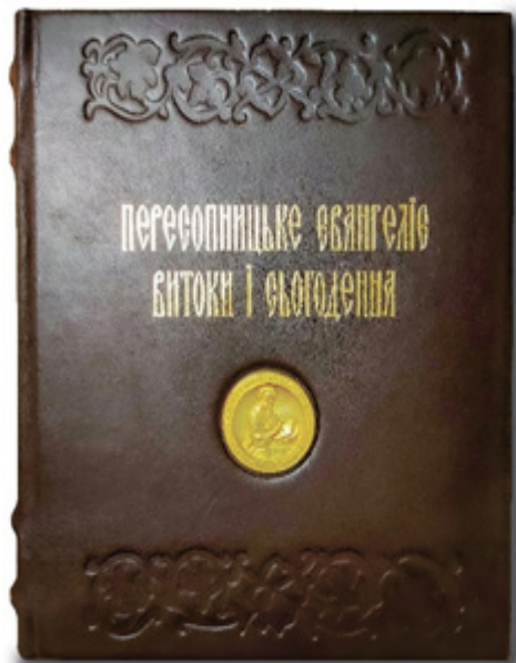
Рис. 3. Шкіряна оправа з медальйонем і тисненням видання «Пересопницьке Євангеліє: витоки і сьогодення» (ВД «АДЕФ-Україна», 2019 р.).

Серед продукції інших українських видавництв також слід відзначити роботи, гідні уваги,