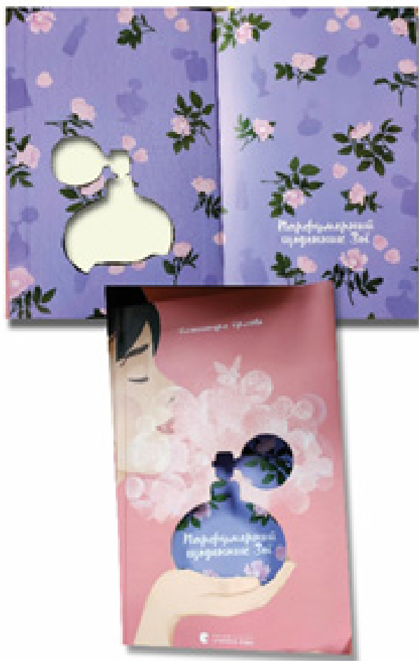
Рис. 4. Оригінальна оправа з перфорацією видання «Парфумерний щоденник Зої» О. Орлової («Видавництво Старого Лева», 2022 р.).

(«Грані-Т», 2010 р.) з інфографікою на вклейках меншого формату; «Лісова пісня» Лесі Українки (Київ, «Основи», 2014 р.) з імітацією суперобкладинки завдяки клапанам; видання В. Кушпета «Школа реконструкції виконавської традиції» з футляром (Київ, «Темпора», 2016 р.), в якому кожен розділ організований окремим томом в обкладинці; «Епістолярний монолог» Я. Стеценка (Дрогобич, «Коло», 2020 р.) у суперобкладинці в стилі графіки Г. Нарбути та з наклейками прямо на сторінках видання з репродукціями екслібрисів його автора; «Парфумерний щоденник Зої» О. Орлової (Львів, «Видавництво Старого Лева», 2022 р.) з перфорованою оправою (Рис. 4) та інші.