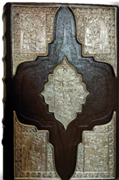
Рис. 2. Шкіряна оправа з металевими чеканими накладками та тисненням факсимільного видання «Пересопницьке Євангеліє» (ВД «АДЕФ-Україна», 2013 р.).