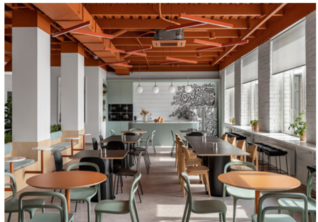
Рис. 2. Дизайн приміщення з просту Promodo Hub & Office. Автори Юлія і Денис Шаталюки.

Дизайн приміщень від авторів Юлії і Дениса Шаталюків поєднує в собі функціональність і високий естетичний стандарт. Особливої уваги заслуговує їхній проєкт «Promodo HUB&OFFICE», дизайн якого відтворює принципи гендерної нейтральності (Рис. 2).