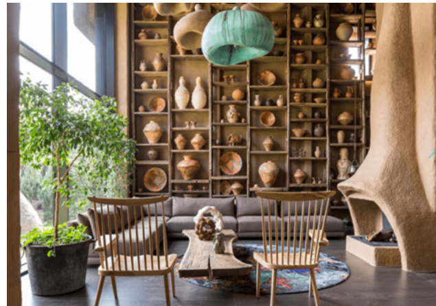
Рис. 3. Shkrub House. Дизайн студії Сергія Махно.

й закликають до переосмислення традиційних гендерних кліше в архітектурі та дизайні.