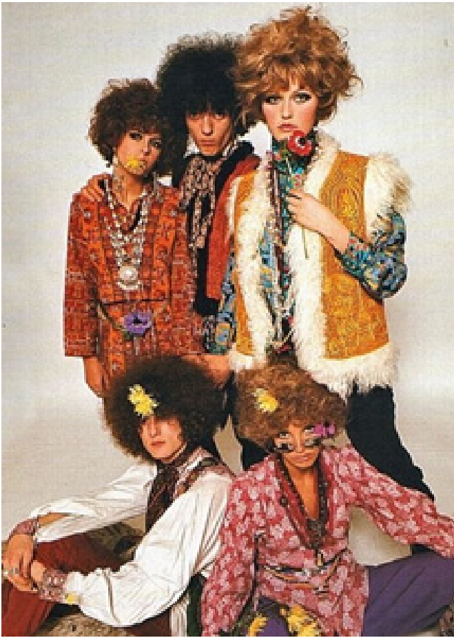
Рис. 3. Hippie Style 1960-х років (Sessions, 2020).

серфінгу, який постійно зростає, та тих, хто хотів додати образ серфера до свого повсякденного гардероба (Рис. 5–6).