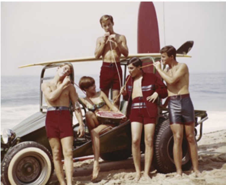
Рис. 5. Серфінгісти 1960-х років (Surfer Style, 2024).