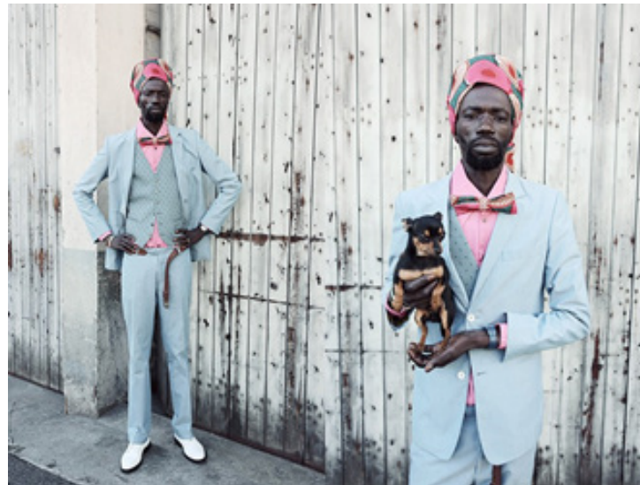
Рис. 22. Rasta Style, чоловічий образ (Constantinescu, 2012).

Описані стилі й субкультури — це лише частина з усього різноманіття стилів в одязі й субкультур, які визначально вплинули на формування Street Style. Стиль мілітарі, субкультура скінхедів, емо, металістів і байкерів, а також японський Street Style зробили свій внесок в еволюцію сучасного Street Style як відображення історії становлення ідентичності, як фасилітатора групової, субкультурної тотожності, зрештою, як важливої частини індустрії масової моди.