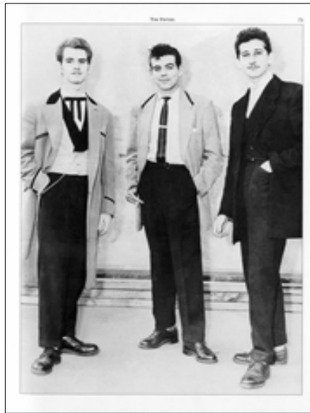
Рис. 10. Стиль Teddy Boy у чоловічому вбранні 1950-ті роки (The forgotten 1950s, 2017).