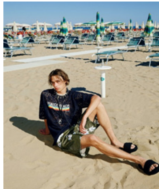
Рис. 6. Surfer Style у молодіжній моді (Surfer Style, 2024).