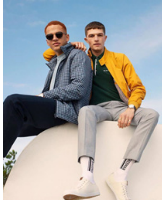
Рис. 13. Mods style у колекції Ben Sherman (Великобританія) (Short, 2020b).