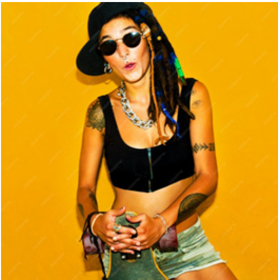
Рис. 21. Rasta Style, жіночий образ (Porechenskaya, n.d.).