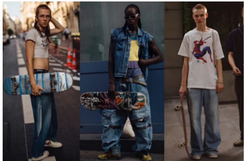
Рис. 8. Скейт-стилі з модних показів весна/літо 2023 (Мілан, Париж) (Spötter, 2023).

Паралельно зі США в Великобританії також виникли й сформувалися впливові субкультури як «акт формалізації» своїх внутрішньогрупових відносин групою молодих людей (Кулик, 2008, с. 19). Так, прагнення англійської молоді виявити себе зумовило появу в 1950-х рр. субкультури Teddy Boy , яка, відроджуючись у 1970-х і 1990-х рр., стала іконою британської популярної культури. На стиль одягу її представників, які мали дохід і протестували, зокрема, проти післявоєнної економії, вплинула мода едвардіанської епохи (аббревіатура від Edwardian, звідси й назва) — чоловіки носили пошиті на замовлення драпові піджаки темних кольорів,