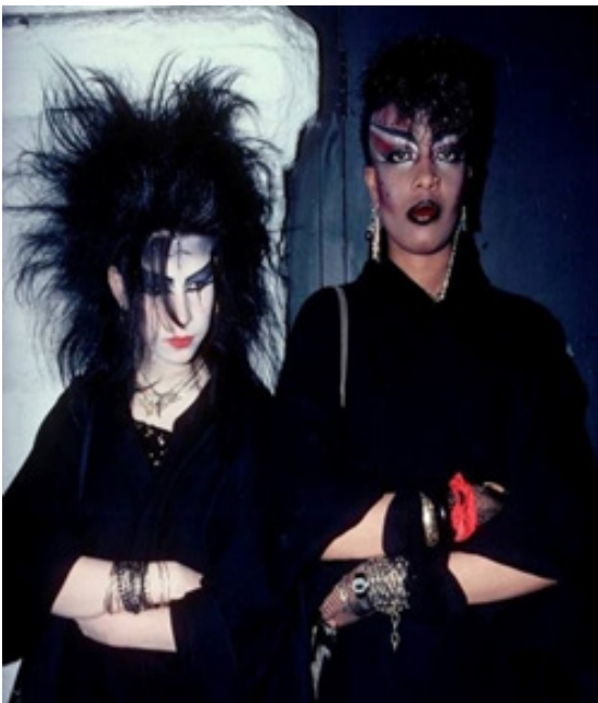
Рис. 16. «Традиційні» готи (Zander, 2024).

або витонченими підвісками, які додають гостроти та елегантності, або рукавички без пальців, панчохи в сіточку тощо. Готичному стилю притаманна наявність елементів історичного костюма — саме це відрізняє його від суто похмурого образу (Рис. 17). Тед Полемус (Polhemus, 1994) описав готичну моду як багатство чорного оксамиту, мережива, рибальських сіток і шкіри з червоним або фіолетовим відтінком, доповнених туго зашнурованими корсетами, рукавичками, хиткими туфлями на шпильках і срібними прикрасами, що зображують релігійні чи окультні теми (р. 97). «Сьогодні готика набуває більш жіночних обрисів, але й дозволяє собі маскуліність, їй вже не властива неохайність, вона дивує неочікуваними поєднаннями» ("Готичний стиль", 2022). Наприклад, у сезоні осінь-зима 2019/2020 готичний стиль був представлений у колекціях Dolce & Gabbana, Prada, Alexander McQueen, Richard Quinn (Рис. 18).