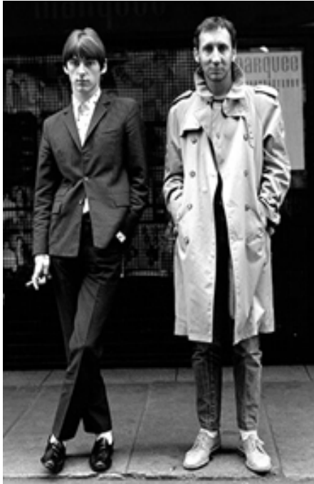
Рис. 12. Mods style 1960-х років (Kershaw, 2016).

з основних фактур панк-моди), латекс, пірсинг, лозунги й специфічні принти, важкі чевіки та надмірні аксесуари (ланцюги, замки, леза) демонструють безпосередній зв'язок між естетикою панк-моди та сучасною модою (Рис. 14–15).