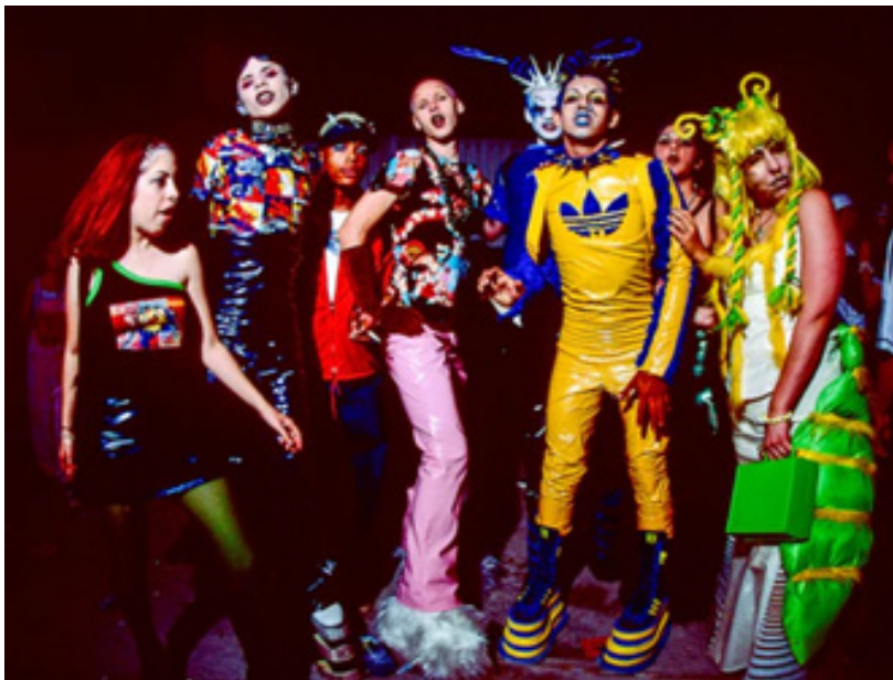
Рис. 19. Rave Style 1990-х років ( The evolution , n.d.).

років рейв-мода суттєво впливала на музичну сцену, і справа не лише в тому, щоб мати гарний вигляд на танцювальному майданчику — Rave Style став вираженням любові до музики та спільноти загалом. Одним із найяскравіших аспектів цієї культури є її унікальний стиль: у 1990-х рр. модним було все, що призначене для легких рухів, вигадливе та калейдоскопічне — пекучо-яскраві неонові й психоделічні принти, бретелі, топи-халтери, а сьогодні — традиційно сліпучо-яскравий неон, комбінезони з геометричним принтом і приталені топи, нічні сонцезахисні окуляри або рейв-окуляри тощо (Рис. 19–20).