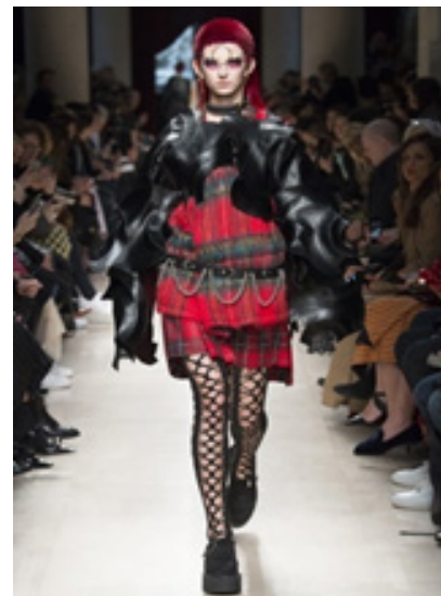
Рис. 15. Колекція Jun Watanabe — осіннє вбрання 2017 (Schmidt-Rees, 2019).

Як альтернатива панку й водночас як бунт проти суспільних норм наприкінці 1970-х рр. виник рух готів , тісно пов'язаний із придушеною підлітковою непокорю, темною стороною маргінальної культури. Goth Style походить від вікторіанського культу трауру (Wilson, 2008),