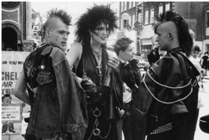
Рис. 14. Панк-мода 1970-х років (Schmidt-Rees, 2019).