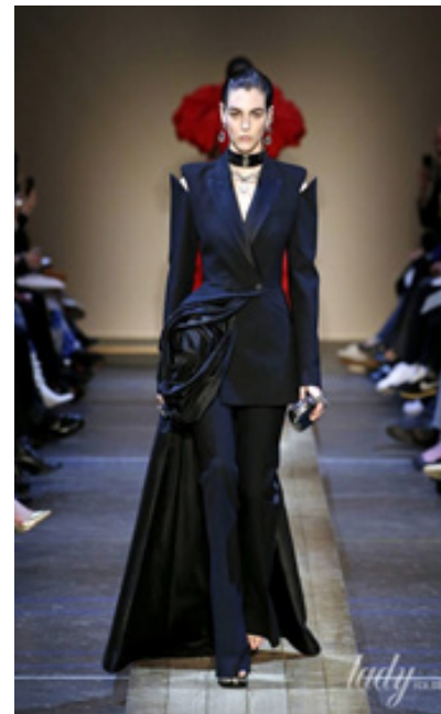
Рис. 18. Готичний стиль у колекції Alexander McQueen, осінь-зима 2019/2020 (Готичний тренд сезону, 2019).

Стійкість стилю субкультури готів «зумовлена дивовижним багатством культурної традиції, на яку вона спирається, та її пластичністю — її неймовірною здатністю поглинати нові впливи у впізнавану послідовну естетику. Візуальний Goth Style залишив таку ж яскраву спадщину, як і його музика, яка продовжує надихати дизайнерів, творчих людей і сучасних підлітків далеко за межами свого початкового винаходу» (Spooner, 2023).