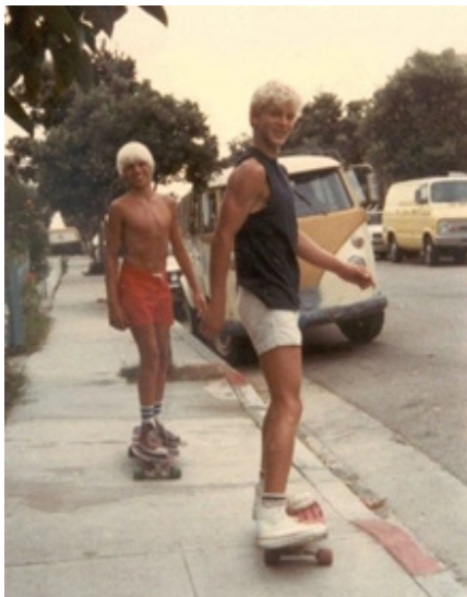
Рис. 7. Скейтбордисти 1970-х років (Peovska, 2020).

толстовками з малюнками, шапками. Унікальність Skate Style зробила його еталоном цілого покоління. З кожним роком стиль одягу скейтбордистів змінювався, його вплив на світ моди лише посилювався і вже з середини 1990-х років став всеосяжним. Skate Style з його елементами хіп-хопу, серфінгу, гранжу, спецодягу та навіть розкоші є невіддільною частиною Street Style — сьогодні Skate Style досяг такого рівня, що його по праву можна вважати «глобальним модним феноменом» (Castillo, 2024). «Від простої футболки з логотипом дерева Element до високоякісної співпраці Supreme з брендами класу люкс — те, як вдягаються скейтери, відіграло важливу роль у формуванні сучасної молодіжної культури та навіть основної моди в усьому світі» (Castillo, 2024) (Рис. 8).