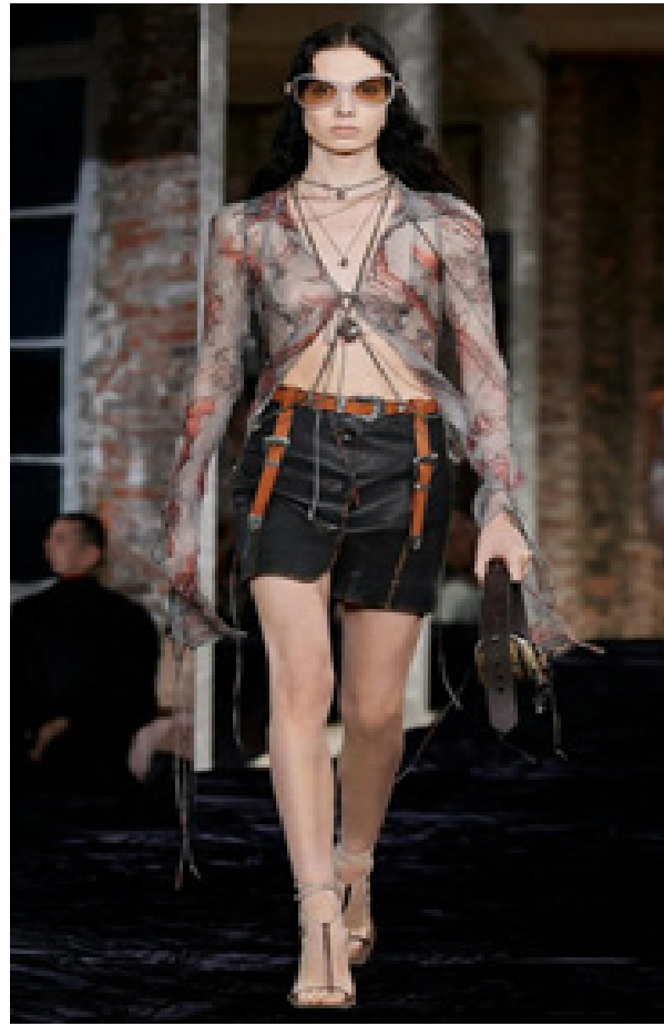
Рис. 4. Hippie Style у сезоні весна/літо 2022 (Sessions, 2020).