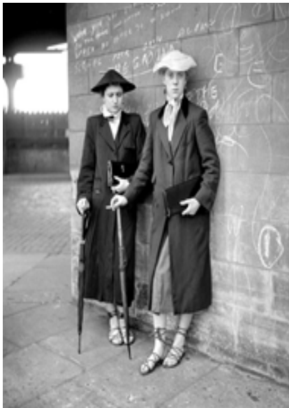
Рис. 9. Стиль Teddy Boy у жіночому вбранні, 1950-ті роки (The forgotten 1950s, 2017).