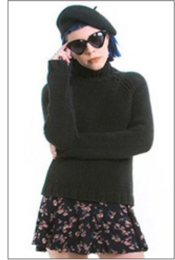
Рис. 2. Beat Style в сучасній моді (Hammad, 2022).