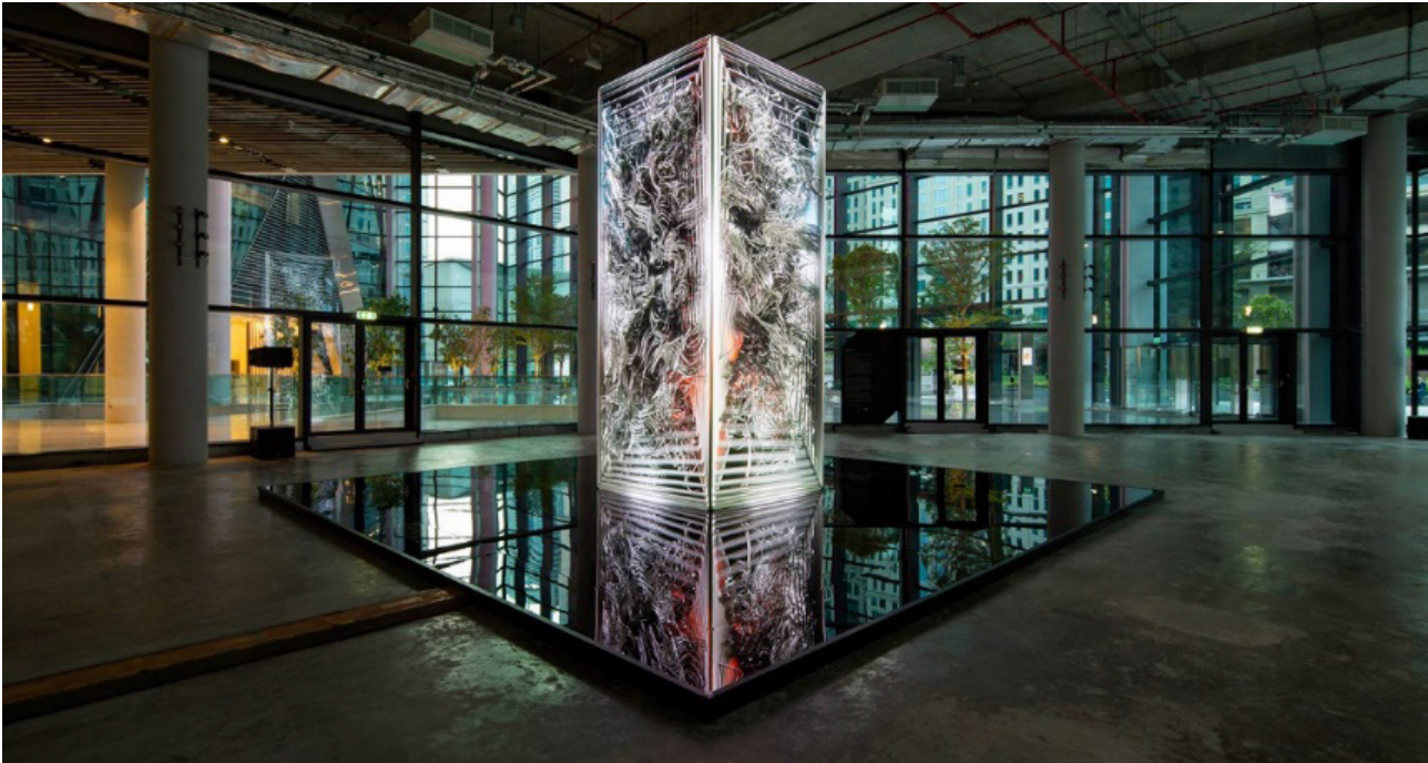
Рис. 3. Інсталяція DATAMONOLITH_AI в ICD Brookfield Place, Dubai, UAE. Дизайн: Art studio Ouchhh.

вих художньо-композиційних принципів від художньо-декоративного до функціонально-утилітарного призначення, під впливом якісних змін взаємозв'язку предметів мистецтва із простором з позицій функціональності та практичності. Історично так склалося, що різні види та жанри мистецтва часто мали лише декоративний характер, задовольняючи естетичні потреби суспільства (McCorquodale, 1983). Проте з розвитком сучасних технологій та зміною поглядів суспільства на предмет мистецтва, перехід від пасивно-оглядової позиції до активної взаємодії з арт-об'єктами розширив діапазон функцій, призначення та використання арт-об'єктів. Сучасні погляди на мистецтво й потреби суспільства відкривають нові можливості методів використання арт-об'єктів — вони набувають функціонально-утилітарного призначення для якісно нової взаємодії між людиною, художнім об'єктом і простором, що відповідно створює нові трансформації методів використання арт-об'єктів у певному («Призначення арт-об'єкта») аспекті взаємозв'язку та створює, крім естетичності простору, комфорт і практичність у повсякденному житті.