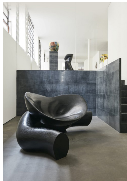
Рис. 4. Функціональний арт-об'єкт, скульптура-крісло в галереї De Cotiis, Milano, Italy. Художник: Wendell Castle.

Характерний приклад функціональної тенденції використання арт-об'єктів в інтер'єрному просторі представлено на Рис. 4.